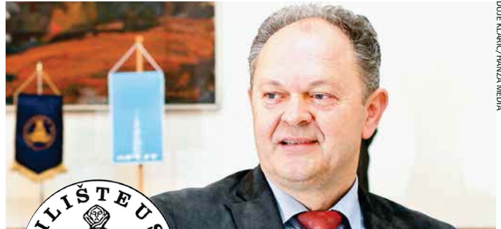
Prof. Šimun Anđelinović, rektor Sveučilišta u Splitu

Vrijeme adventa vrijeme je iščekivanja i prigušene radosti zbog predstojećeg božićnog i novogodišnjeg čestitanja i darivanja. I čini mi se kako ni jedno drugo vrijeme nije sličnije karakteru poslanja akademske zajednice. Nije li znanstveni rad vrijeme tihe i postojeće pripreve u okviru koje se brusi vlastiti duh, a nastava vrijeme dijeljenja i darivanja znanja drugima i drugačijima? Znanstvenici i umjetnici kao nastavnici kroz istraživanje i stvaralaštvo žude za novim spoznajama, a studenti za otkrivanjem i preuzimanjem novih, simbolički, ali i stvarno darovanih znanja, vještina i sposobnosti. Usprkos i nasuprot društveno sve prihvatljivijoj prštavoj i blještavoj konzumerističkoj formi Božića koja je često tek supstitucija ispraznosti, akademska zajednica u kontemplaciji i tišini tumači stare sadržaje, ali otkriva i daruje nove. Upravo to novo i drugačije je ono po čemu Sveučilište u Splitu nastoji doprinijeti istinskoj kulturi božićnih i novogodišnjih blagdana. To su univerzalne vrijednosti koje se uvijek i iznova obogaćuju novim spoznajnim horizontima kroz kritičko promišljanje o danas za sutra, uz neizostavno promicanje akademske čestitosti kao izvora nade za budućnost. U to ime svim studentima, nastavnicima i djelatnicima želim čestit Božić i nazivam svima "na dobro Vam došlo Mlado lito!"